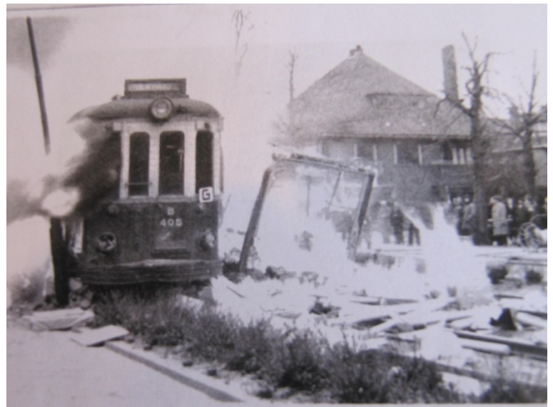
foto boven: Botsing met een vrachtauto op Parkweg te Voorburg. januari 1959.