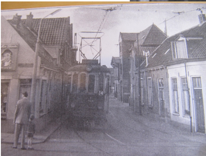
Onverstelbaar!!! Tram in Katwijk.

10 mei 1958. Echt de laatste "Voorburger" A.506. Wagenvoeder Cornet .