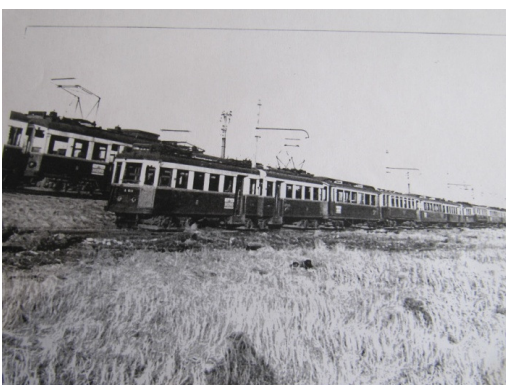
Het trieste einde. Het sloopterrein aan de korte Vliet te Voorschoten.. 17-1-1962./// A512 – A611/612 – B23 – B15 – B 22 – A606/605 B14 – B21 – A601/602.

Inhaken op jouw verhaal over het ontstaan van de NZH heb ik hier nog wat leuke foto's over het tramperk met hierop personeel dat later op de buslijnen dienst heeft gedaan. Foto's in het bijzonder over de afdeling Voorburg. Ik heb grote belangstelling over die periode en ben in het bezit van nogal wat documentatie zodat ik een aanzet kan geven tot een rubriek "NZH het tramtijdperk". Zo maar een idee! Ik hoop dat dit waardevol zal zijn voor Uw nieuwsbrief en reüniekrant voor oud personeel ooit in dienst bij de NZH.