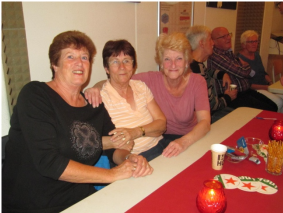
Dit vond ik een leuke foto's. Maar helaas weet ik de namen van deze dames niet.