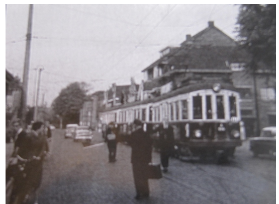
Forensen tram inrukkend na de ochtendspits september 1961.